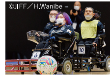
・電動車椅子サッカー