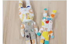
・ぬいぐるみ作り