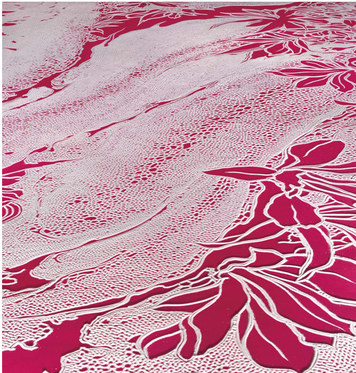
© 2018 Motoi Yamamoto / 東アジア文化都市2018金沢「変容する家」

51st International Home Care and Rehabilitation Exhibition