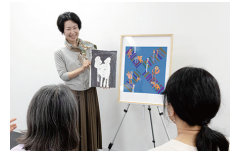
・対話型アート鑑賞

障害者就労支援施設での作業風景がそのままH.C.R.会場に再現。作品を、見て、さわって、制作体験できます!